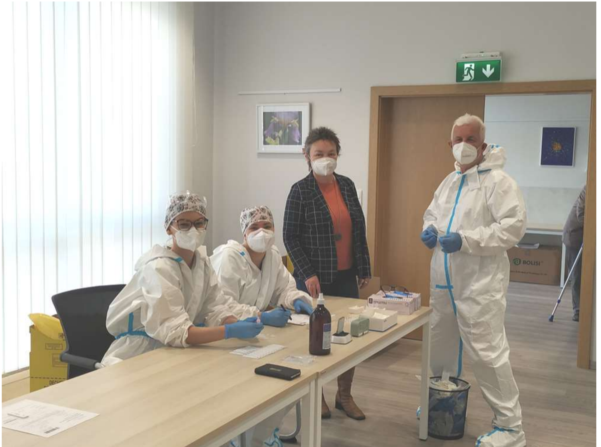
Gut angenommen werden die kostenlosen Covid-19 Tests im Gemeindezentrum Bernstein. Ihre Gesundheit liegt uns am Herzen