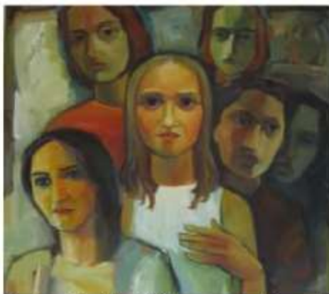
Peter Petky/Kőszeger Kunst