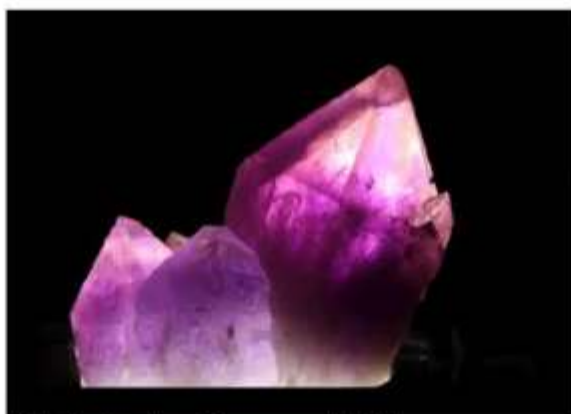
Kristalle im Rampenlicht