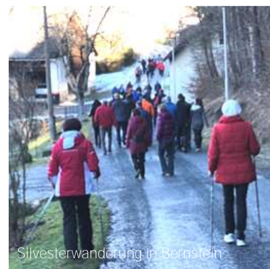
Silvesterwanderung in Bernstein

Kein Nenngeld! Teilnahme auf eigene Gefahr!