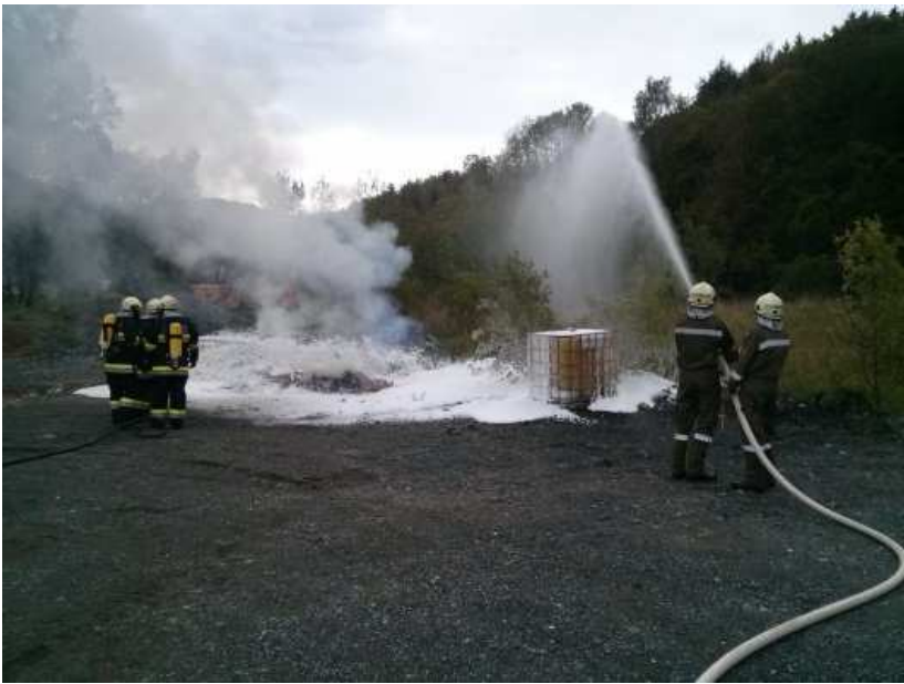
Inspizierung mit der FF-Dreihütten in Rettenbach am 15.05.2014