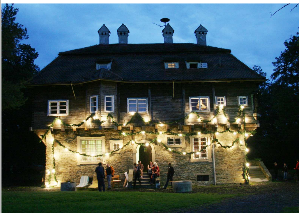
Im Rahmen des Burning Stones Festival erstrahlte das Madonnenschlössl in einem Lichtermeer