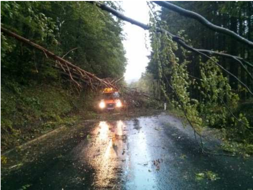
Straßensperre am 15.05.2014