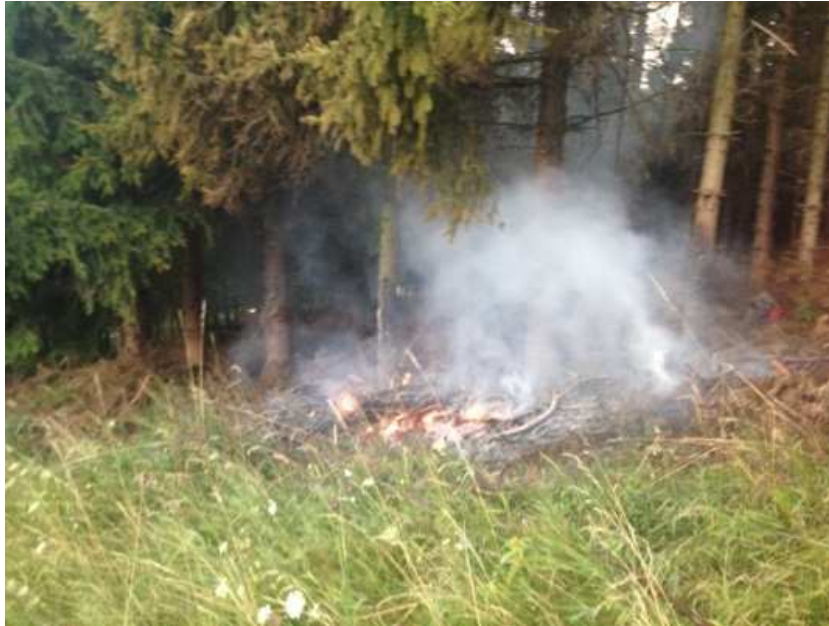
Waldbrand durch Blitzschlag am 19.08.2014